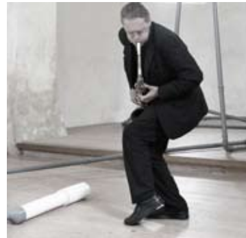
Urs Leimgruber Sopran- Tenor Sax