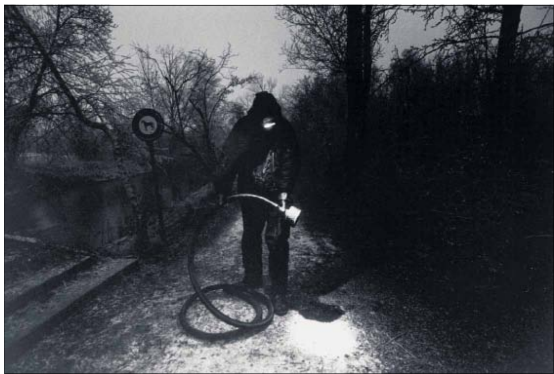
In Frischwasser, mit Schlauch und Pumpe in Kanister abgefüllt, tritt das Plankton seine letzte Reise an.

zweifellos auch für den Planktonfischer und mich. Japaner fischen Plankton, Krill, machen Paste daraus, essen diese und leben lang. Noch liegen die Fänge weit unter den erlaubten Quoten, und Krill gibt es wahrlich viel. Sollte es aber eines Tages so weit kommen, dass die ganze Welt aus Not oder Gier sich Krill strudelt, dann wäre eine solche Überfischung viel verheerender als die Dezimierung von Kabeljau und Konsorten. Der Nahrungskette würde eines der ersten Glieder entfernt.