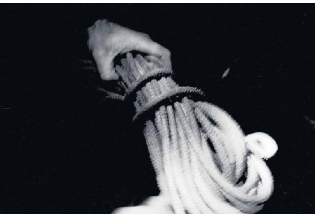
Handgriffe über dem Wasser verknüpfen sich zu Handlungen, um Plankton zu strudeln.